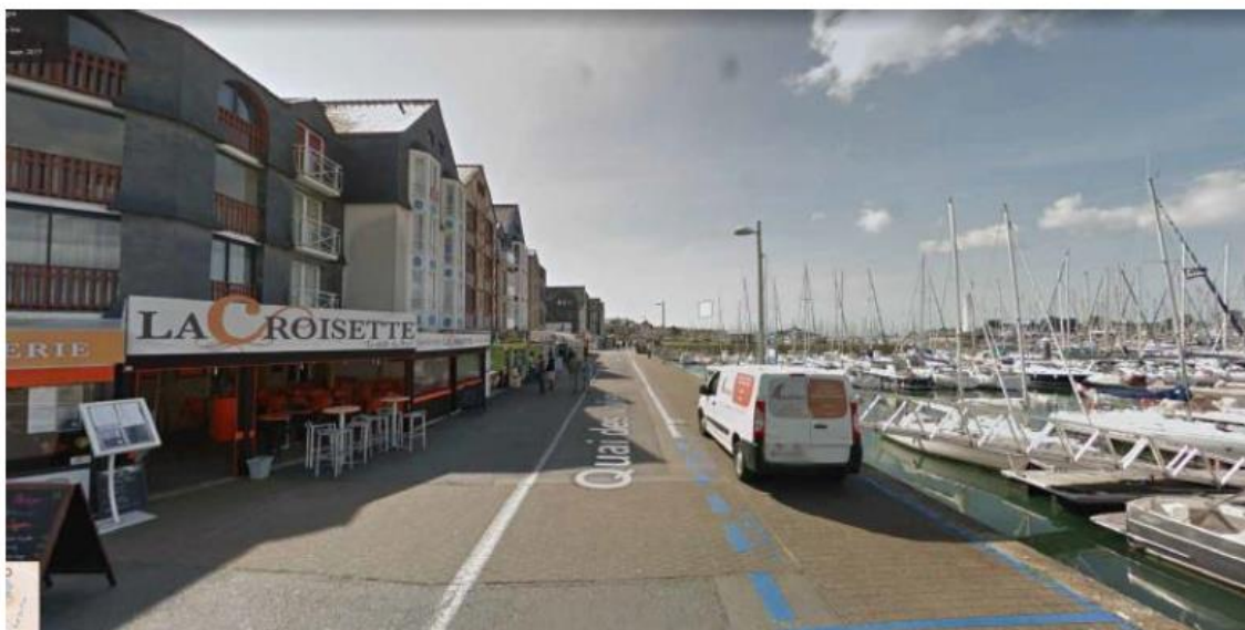
Photo 1 : Vue du quai des voiliers où se côtoient différents usages

Cependant, cet espace connaît aujourd'hui une problématique de conflits d'usages, notamment dû à un manque d'espace au niveau du quai existant.