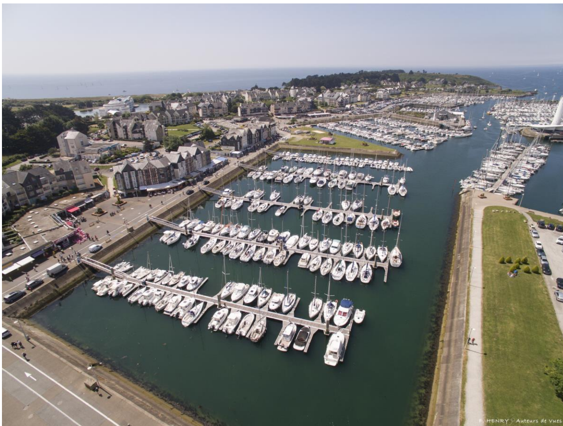
Photo 2 : Vue sur la darse Est et le long du linéaire du quai des voiliers