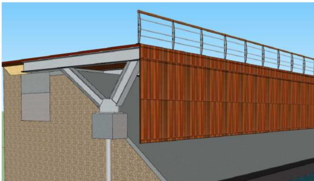
Figure 2 : Vue de l'estacade

Le projet prévoit un élargissement du quai des voiliers par verticalisation du perré, sur un linéaire de 200m en privilégiant la technique de l'estacade (figure suivante).