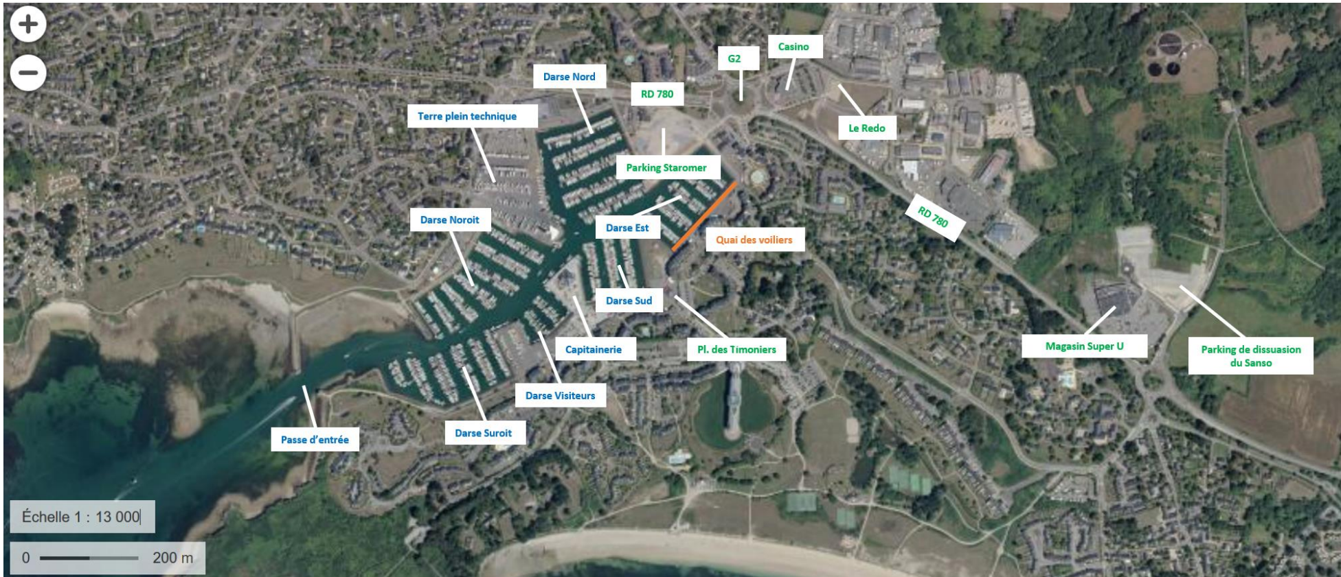
Figure 1: Organisation actuelle des aménagements portuaires et urbains du port du Croesty et de la ville d'Arzon